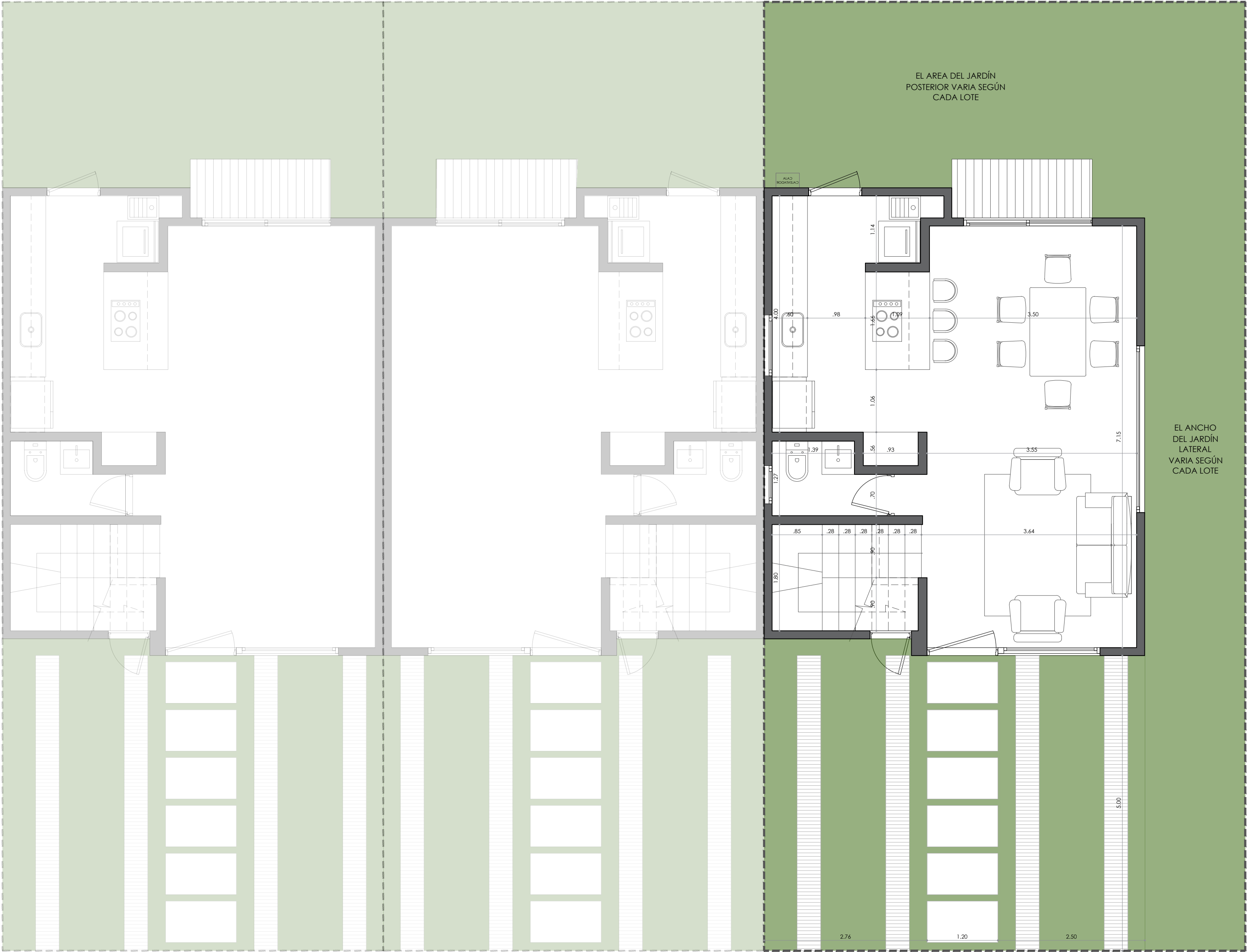
(A3) CASA CAYENA ESPECIAL: ESQUINERA IZQUIERDA TOTAL ÁREA CONSTRUIDA: 109,37 M2